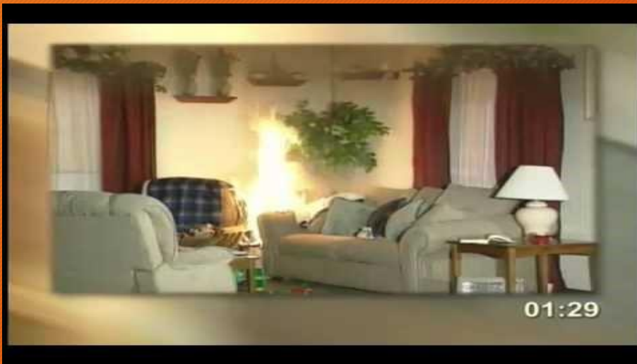
Egy 3 perces video egy szobatűzről